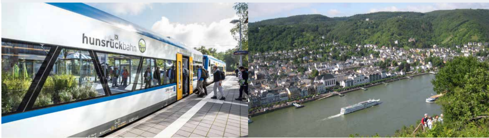
In Emmelshausen ist Endstation für die Hunsrückbahn.

Tickets und Preisstufen sind nur als Auszug dargestellt. Das vollständige Angebot finden Sie unter www.vrm.info oder fragen Sie die VRM-Info-Hotline (siehe Rückseite). Tarifstand: 01.01.2020